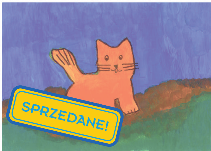
22. „Kot czy pies„ Praca wspólna Instytut Pomnik - Centrum Zdrowia Dziecka w Warszawie, Klinika Onkologii