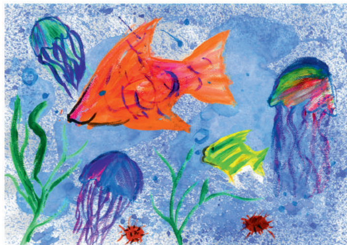
20. „Podwodny świat„ Mikołaj Dudek z mamą, 4 lata Zespół Szkół Specjalnych nr 3 przy Uniwersyteckim Szpitalu Dziecięcym w Krakowie, Klinika Onkologii i Hematologii Dziecięcej