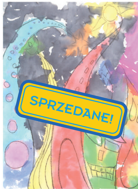
14. „Krzywe domy, Szymon Wywiął, 8 lat Ponadregionalne Centrum Onkologii Dziecięcej "Przylądek Nadziei" we Wrocławiu